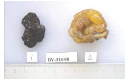
Figura 2: 1.- apéndice epiploica necrosada 2.- apéndice vermiforme.

No2.-Se recibe fijado en formol, pieza quirúrgica correspondiente a apéndice cecal, que mide 7x0.3cm. La serosa es lisa, brillante, blanquecina, alternando con abundante meso. Al corte, pared de consistencia elástica, con espesor de 0.1cm, luz ocupada por escaso material pastoso amarillento. Se incluyen muestras representativas para estudio histológico.